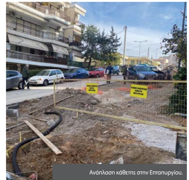
Ανάπλαση κάθετης στην Επταπυργίου.