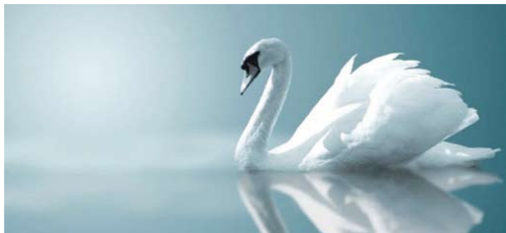
Το «ΕΤ» δημοσιεύει αυτούσια τα κείμενα των παρατάξεων και ουδέμία ευθύνη φέρει για το περιεχόμενό τους

Αγαπημένοι μας συνδημότες. Είναι η τελευταία φορά που γράφουμε σαν παράταξη στο περιοδικό. Η παράταξη «ΚΟΙΝΩΝΙΚΗ ΣΥΝΕΡΓΑΣΙΑ» από 1/1/2024 δεν θα βρίσκεται στα έδρανα του δημοτικού συμβουλίου όπως τα 4 προηγούμενα χρόνια, αλλά θα συνεχίσει να βρίσκεται δίπλα σας ώστε να βοηθάει ή να αναδεικνύει οποιοδήποτε θέμα έχετε για την περιοχή μας.