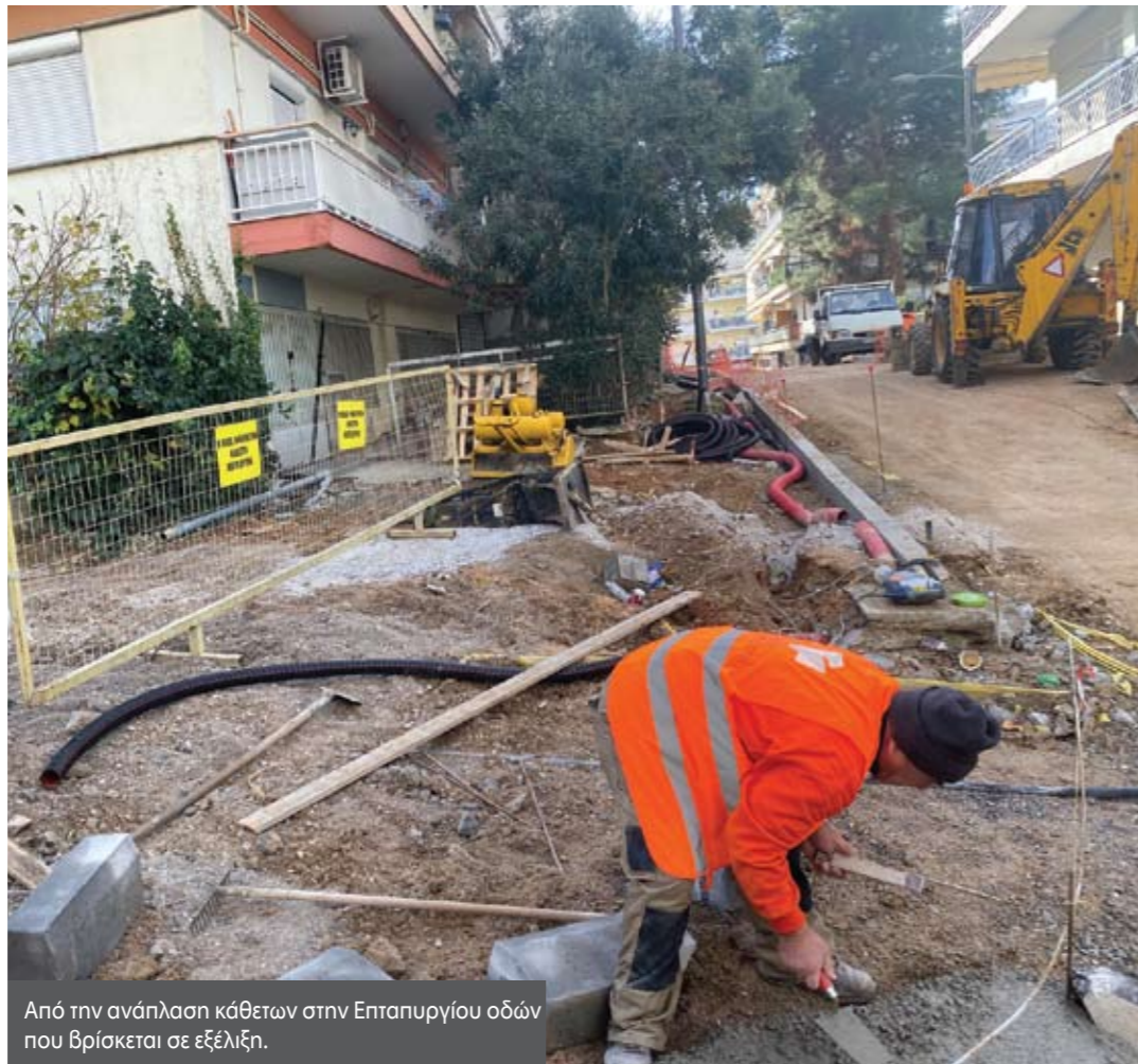
Από την ανάπλαση κάθετων στην Επταπυργίου οδών που βρίσκεται σε εξέλιξη.