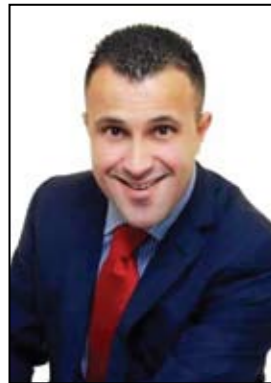
Γράφει ο Μπαπούλας Στέλλιος Κωνσταντίνος