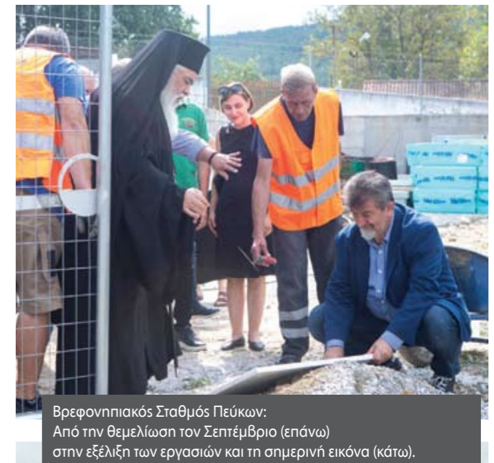
Βρεφονηπιακός Σταθμός Πεύκων: Από την θεμελίωση τον Σεπτέμβριο (επάνω) στην εξέλιξη των εργασιών και τη σημερινή εικόνα (κάτω).

Ένας πρότυπος βρεφονηπιακός και παιδικός σταθμός-στολίδι για την ευρύτερη περιοχή θεμελιώθηκε τον Σεπτέμβριο στα Πεύκα στην οδό Αγίας Τριάδος (γωνία με Παπάφη) από τον δήμαρχο Νεάπολης-Συκεών Σίμο Δανιηλίδη. Πρόκειται για μία υπερσύγχρονη δομή προϋπολογισμού 4.400.000 ευρώ και δυναμικότητας 170 παιδιών από 6 μηνών έως 4,5 ετών. Η χρηματοδότηση είναι είναι ήδη εξασφαλισμένη μέσω του προγράμματος «Αντώνης Τρίτσης», ενώ ο δήμος συνεργάστηκε με την Αναπτυξιακή Μείζονος Θεσσαλονίκης για την μελετητική ωρίμανση του έργου (αφού είχε προηγηθεί η ομόφωνη απόφαση του δημοτικού συμβουλίου το 2019 και η μελέτη από την αρμόδια αντιδημαρχία) από τον Μάρτιο του 2020 ενώ για να εγκριθεί μία μικρή παρέκκλιση στο εσωτερικό του κτιρίου από το αρμόδιο υπουργείο πέρασαν σχεδόν δύο χρόνια (Ιούλιος 2020 ή αίτηση, Απρίλιος 2022 η έγκριση). Ο βρεφονηπιακός-παιδικός σταθμός των Πεύκων θα διαθέτει θερμομόνωση, ηχομόνωση και εξελιγμένο σύστημα πυρασφάλειας. Όλος ο εξοπλισμός, η επίπλωση, τα κρεβατάκια, τα τραπέζια, οι παιδικοί πάγκοι καθώς και η παιδική χαρά στον αύλειο χώρο αλλά και τα παιδικά παιχνίδια για τους εσωτερικούς και τον εξωτερικό χώρο προβλέπονται και περιγράφονται λεπτομερώς από τη μελέτη της Τεχνικής Υπηρεσίας του δήμου Νεάπολης-Συκεών με βάση τις πιο σύγχρονες προδιαγραφές που ισχύουν διεθνώς.