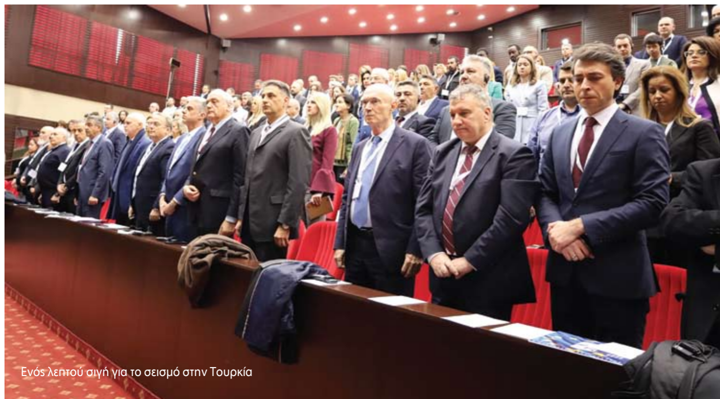
Ενός λεπτού σιγή για το σεισμό στην Τουρκία

αρχές, με άλλα πανεπιστήμια της Βουλγαρίας και του εξωτερικού, καθώς και με επιχειρήσεις», είπε ο πρόεδρος του UNWE καθηγητής. Δρ. Dimitar Dimitrov. Αξίζει να σημειωθεί ότι από το συγκεκριμένο πανεπιστήμιο το οποίο φέτος κλείνει 103 χρόνια ζωής έχουν αποφοιτήσει 10 πρωθυπουργοί της Βουλγαρίας και 150 υπουργοί εκ των οποίων οι 87 υπηρετούν στην παρούσα κυβέρνηση.