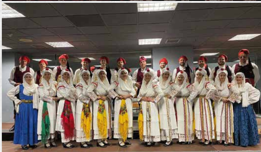
Χορευτικό συγκρότημα Ιερού Ναού Αγίου Γεωργίου Νεάπολης «Αγία Φωτεινή η Νεαπολίτις».