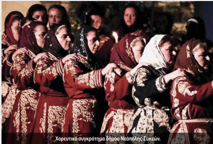
Χορευτικό συγκρότημα δήμου Νεάπολης-Συκεών.